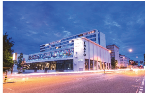
TRAF0 Baden

Formation et Manifestations Grütlistrasse 44, Case postale 8027 Zurich Tél. +41 44 288 33 33 m.mathys@svgw.ch