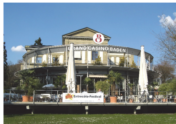
Grand Casino Baden