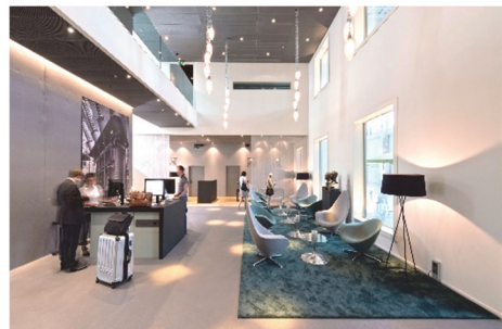
TRAF0 Hôtel

Veuillez réserver votre chambre à temps directement auprès de l'hôtel correspondant de votre choix. Le TRAF0 dispose de son propre hôtel au charme urbain et industriel.