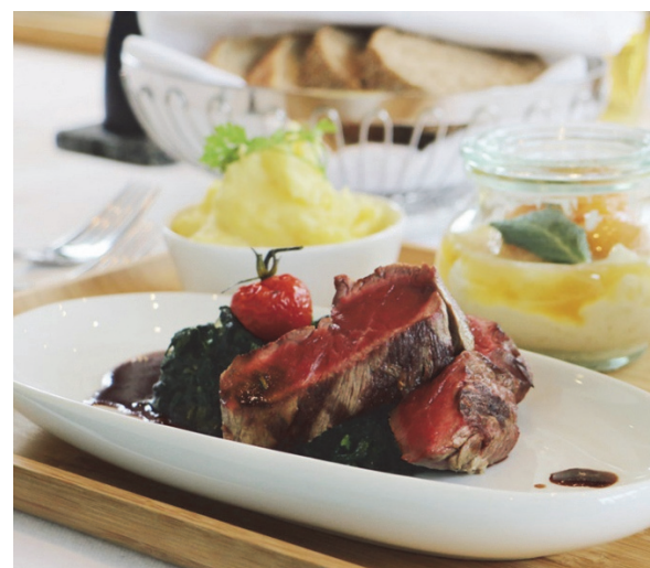
Repas au restaurant PLÜ

Image page de couverture : Vieille ville de Baden avec pont en bois traversant la Limmat.