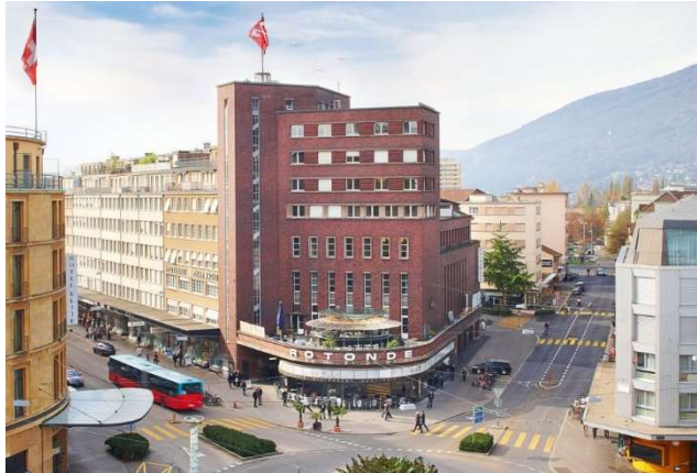
Maison du Peuple

Maison du Peuple Rue d'Aarberg 112, CH-2502 Bienne, Tél. +41 32 329 19 19 www.ctsbiel-bienne.ch