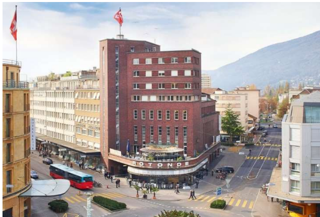
Volkshaus Biel

Veranstaltungsort Volkshaus Biel Aarbergstrasse 112, CH-2502 Biel, Tel. +41 32 329 19 19 www.ctsbiel-bienne.ch