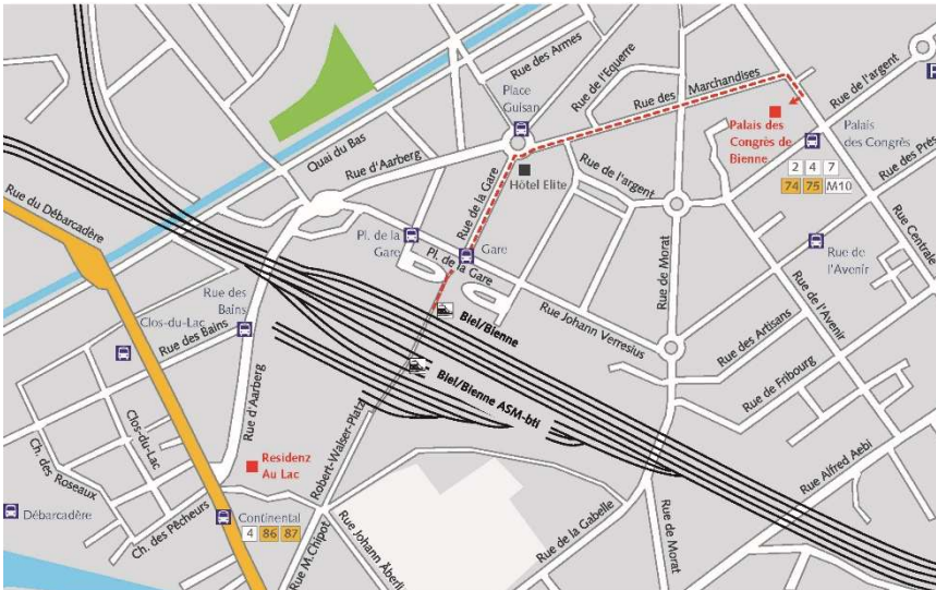
Plan de situation Bienne

En transports publics 10 minutes à pied de la gare de Bienne; suivre la Rue de la Gare jusqu'à l'hôtel Elite, tourner à droite dans la Rue des Marchandises, puis toujours tout droit jusqu'à la Rue Centrale.