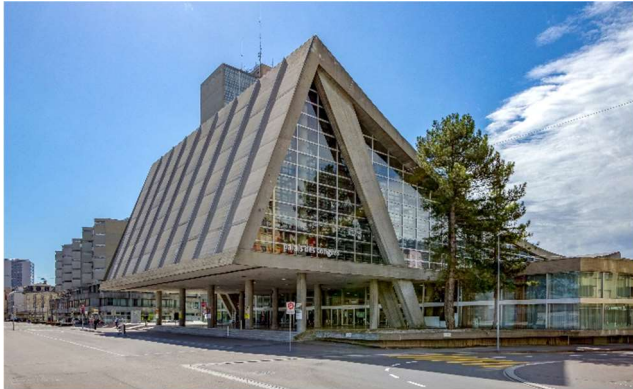
Palais des Congrès de Bienne

Lieu CTS - Palais des Congrès de Bienne Rue Centrale 60, CH-2501 Bienne, Tél. +41 32 329 19 19 www.ctsbiel-bienne.ch