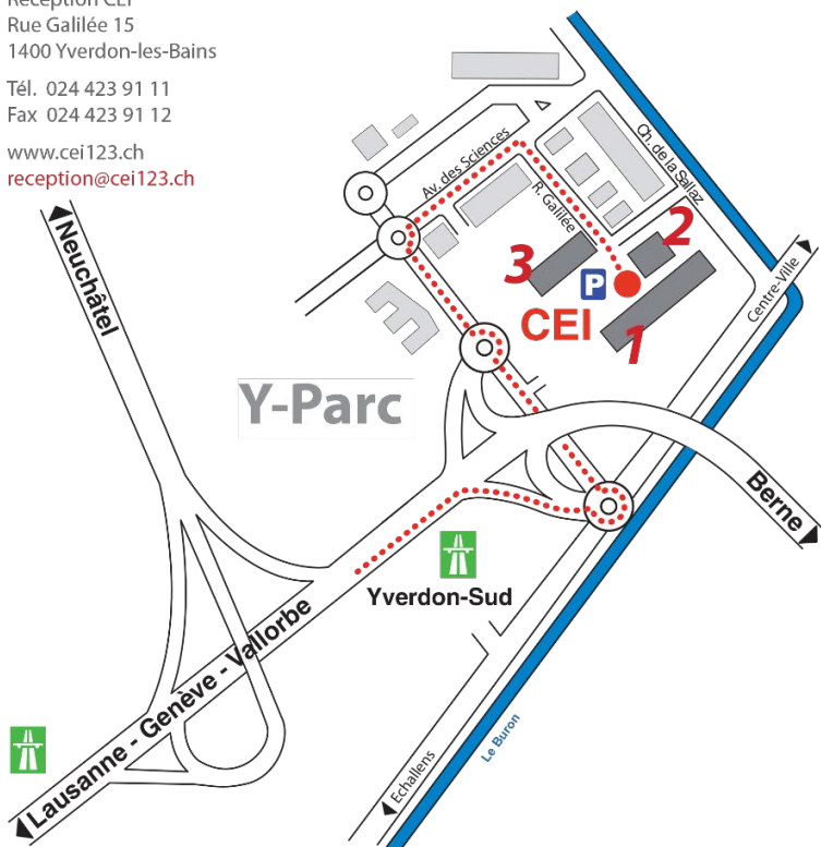
Entrée bâtiment 1

Réception CEI Rue Galilée 15 1400 Yverdon-les-Bains Tél. 024 423 91 11 Fax 024 423 91 12 www.cei123.ch reception@cei123.ch