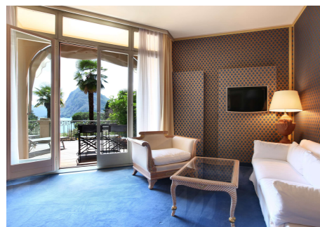
Hotel in Lugano

Bitte buchen Sie Ihr Zimmer frühzeitig direkt beim entsprechenden Hotel Ihrer Wahl. Eine unverbindliche Hotelliste finden Sie auf www.svgw.ch/jv25 . Wir verfügen beim Hotel Zurigo über ein gewisses Kontingent an Hotelzimmern zu einem Vorzugspreis. Buchen Sie Ihr Zimmer mit dem Vermerk «SVGW» direkt über hotelzurigo@horizoncollection.ch oder unter Tel. +41 91 923 43 43.