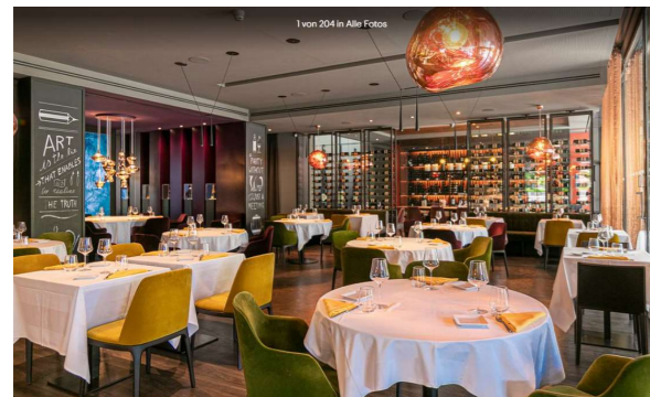
Ciani Lugano