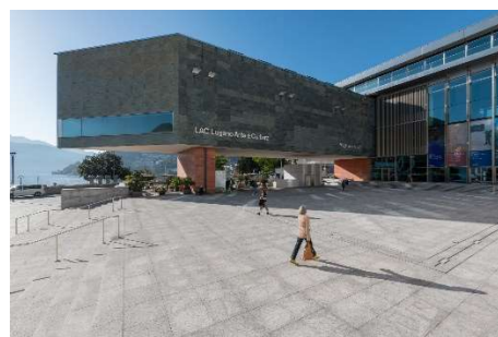
LAC Lugano Arte e Cultura

Ausbildung und Veranstaltungen Grütlistrasse 44, Postfach 8027 Zürich Tel. +41 44 288 33 33 m.mathys@svgw.ch