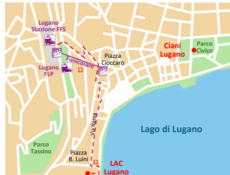
Situationsplan Lugano © SVGW

Ab Bus-Haltestelle «Piazzale Nord» des Bahnhofes Lugano Stazione SBB mit dem Bus der Linie Nr. 4 Richtung «Lugano-Centro» bis Haltestelle «Piazza Luini». Fahrzeit: ca. 6 Minuten.